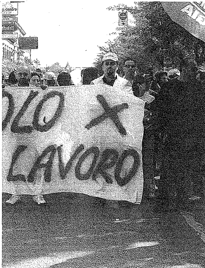
PIENA EMERGENZA Una manifestazione di lavoratori

Tutto questo naturalmente si riflette sui consumi in caduta libera. Da noi la spesa media per persona è pari a 773 euro (98° posto in Italia). «Un dato - osserva la Cgil - molto al di sotto della soglia di povertà che l'Istat ha calcolato nel 2007 in 986 euro di spesa media per persona».