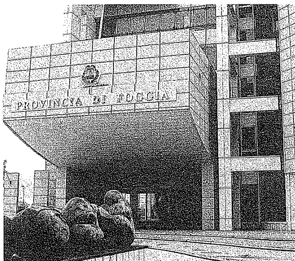
FOGGIA Il Palazzo della Provincia in via Telesforo

Partendo da queste considerazioni, il Partito Democratico ha fatto rilevare all'assessore e alla struttura tecnica la necessità di «ampliare l'intervento all'intera pianta organica per colmare i sempre più evidenti deficit di professionalità», determinati dal-